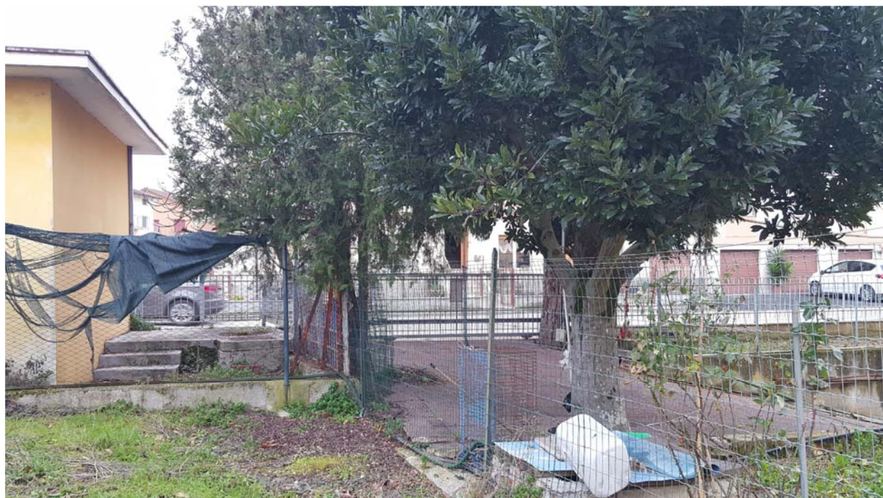
VISTA 5 - 20/01/2017