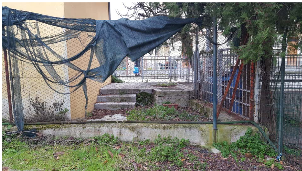
VISTA 6 - 05/12/2016