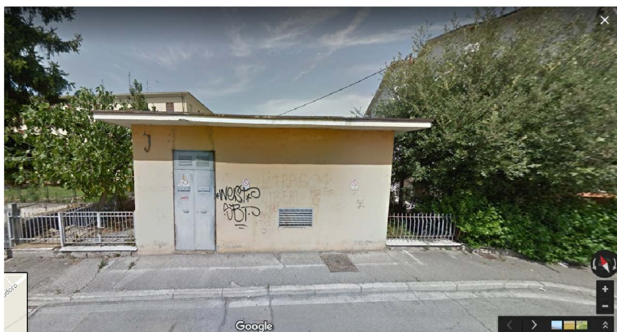
VISTA 2 - da google maps street view (aggiornato a luglio 2017)