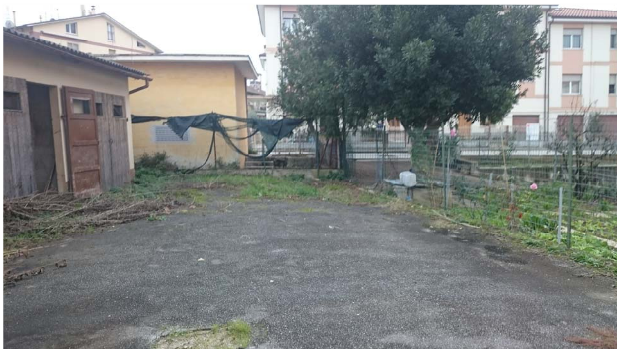
VISTA 4 - 20/01/2017