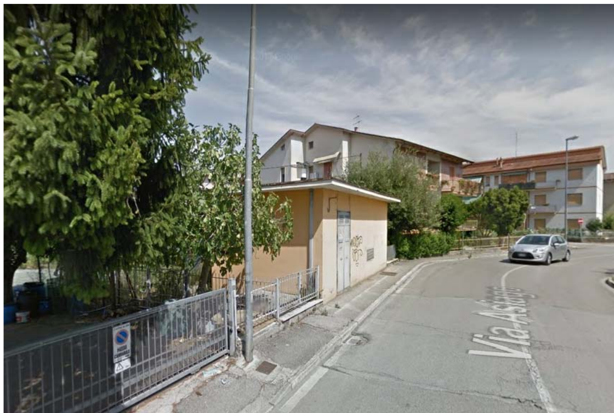
VISTA 3 (aggiornato a luglio 2017)