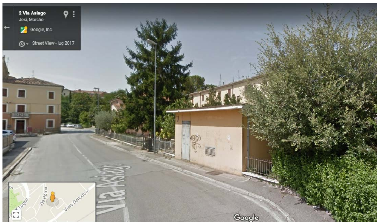
VISTA 1 (aggiornato a luglio 2017)