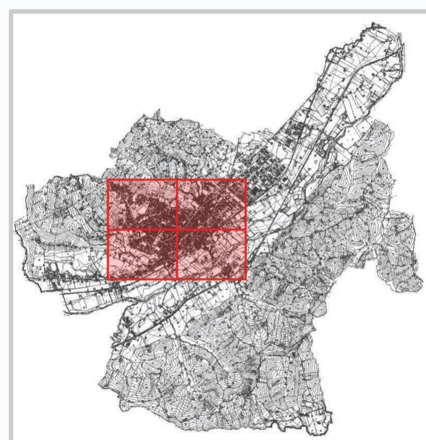
Ambito del territorio comunale in oggetto di rilievo