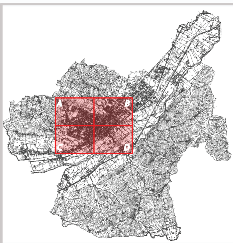
Ambito del territorio comunale in oggetto di rilievo Identificazione dei quadranti