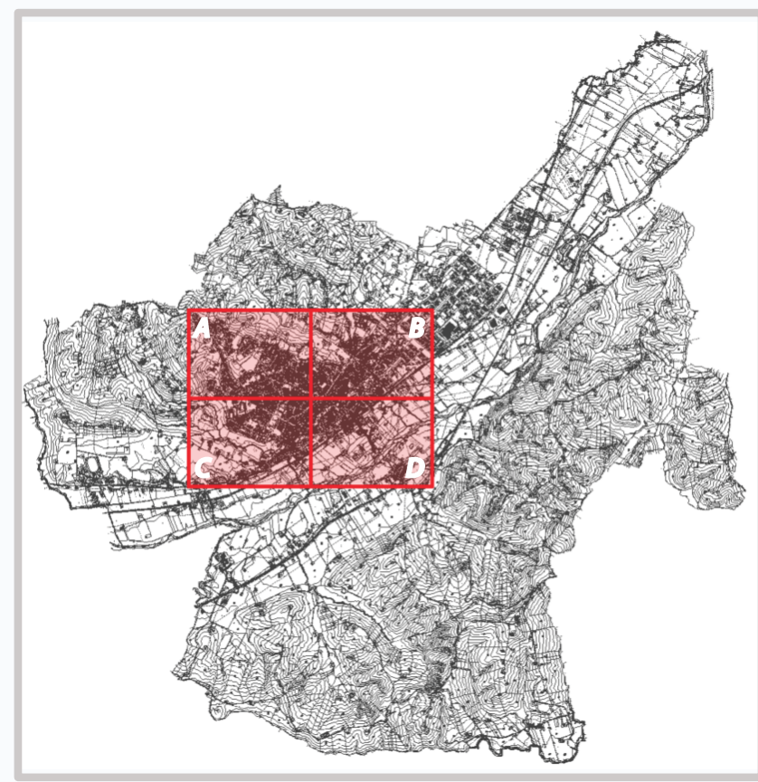
Ambito del territorio comunale in oggetto di rilievo Identificazione dei quadranti